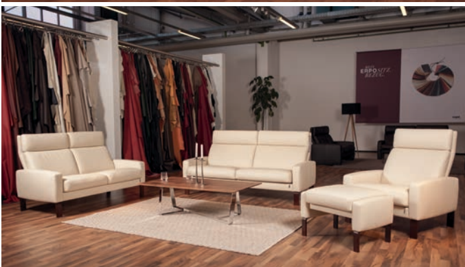
Das Hochlehnermodell „Lund“ ergänzt den Bereich „Collection“.